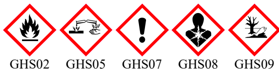
GHS02 GHS05 GHS07 GHS08 GHS09